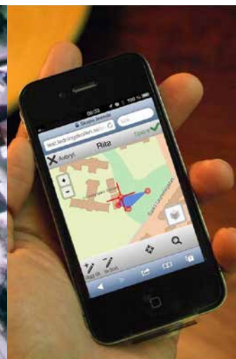
Håll koll via mobilen.